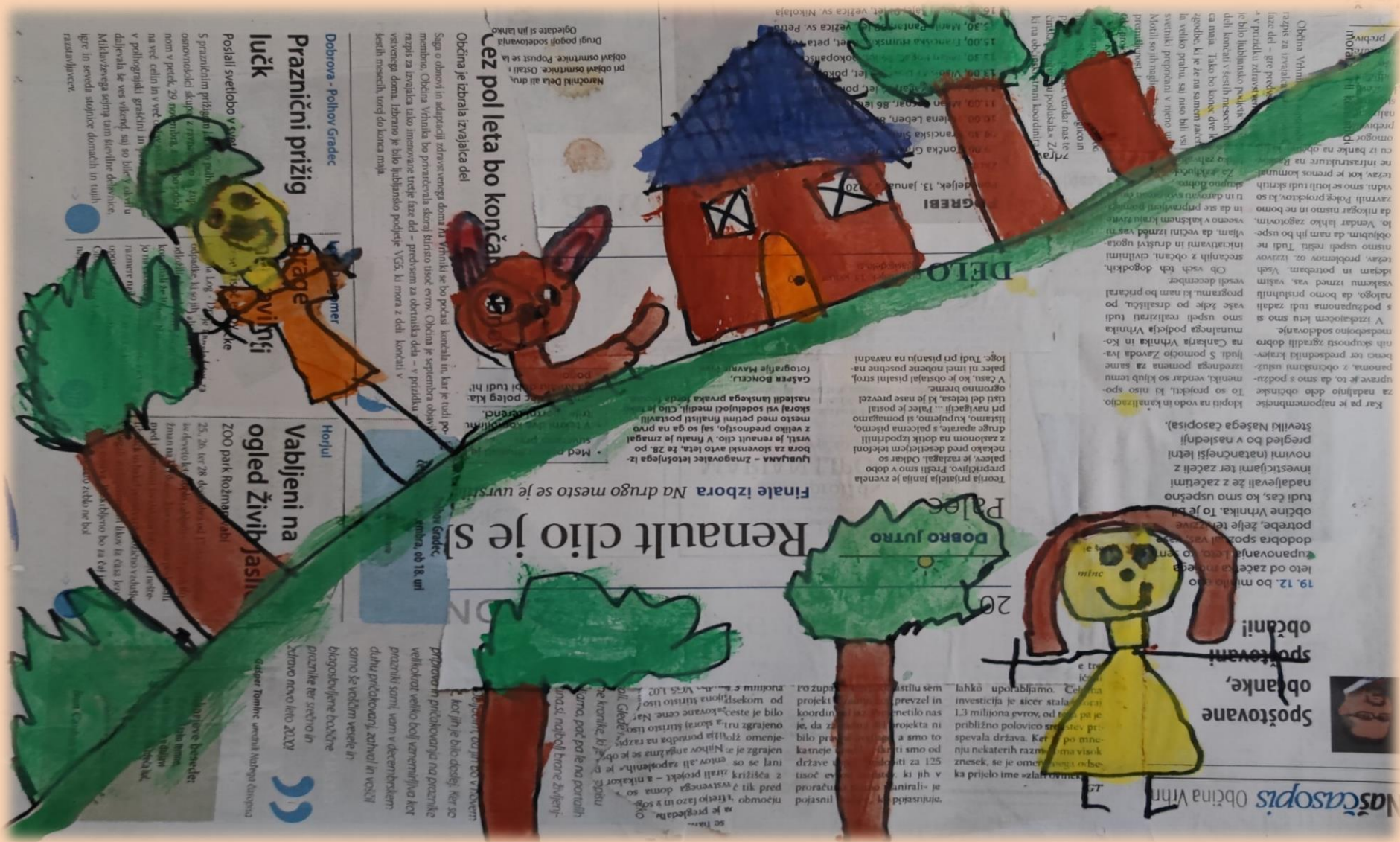
OŠ Janka Kersnika Brdo, Lukovica